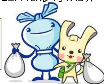
へら星人イーオ ミーオ